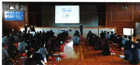
倉敷鷺羽高校のみなさん