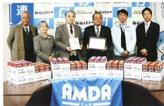
こども食堂・連合岡山と共に